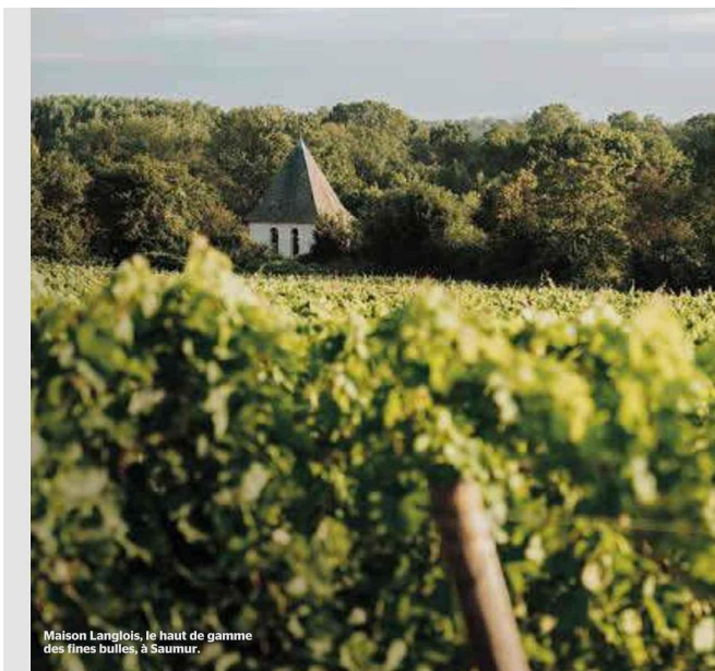
Maison Langlois, le haut de gamme des fines bulles, à Saumur.